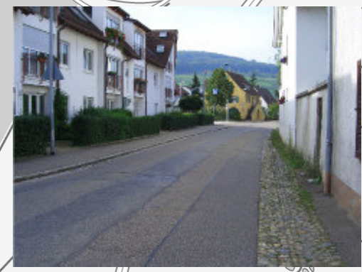
"Malteserordenstraße" mit Abzweig "Obergasse"