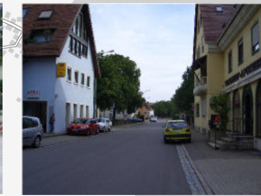
"Andreas-Hofer-Straße" im Bereich "Kapellenwinkel"