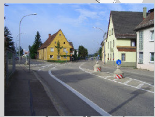
Westliche "Basler Landstraße" mit Abzweig der "Tiengener Straße"

schwierige Streckenführung durch Altortbereich, u. U.Häuserabbruch notwendig. (Sensibler Platzraum "Kirche St. Georg")