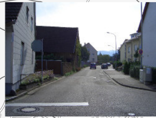
"Hartkirchweg" östlich der "Malteserordenstraße"