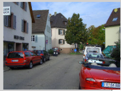
Engstelle "Hartkirchweg" zwischen "Basler Landstraße" und "Malteserordenstraße"