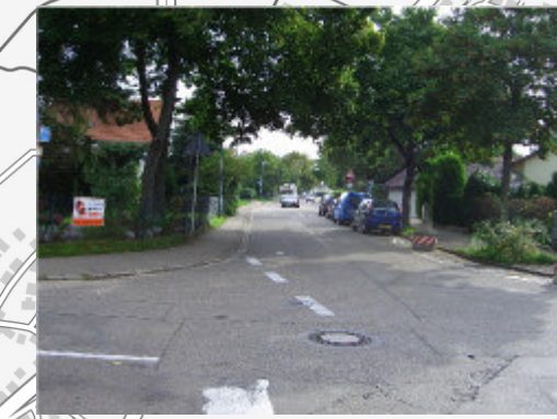
"Hartkirchweg" östlich der "Blumenstraße"